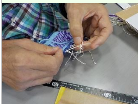
布端を1本取りで結ぶ