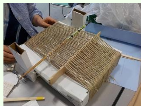
綜統付き織機開発中