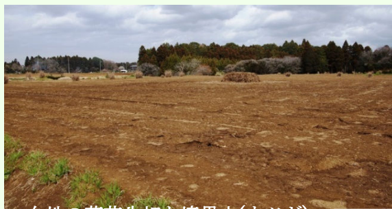
台地の落花生畑と境界木(ウツギ)

坂道を登った標高 40m 程の台地で初めて赤土の落花生畑を見て「八街に来た」ことを納得。また水田地帯に下り、かつて県中央博の展示モデルにもなったという典型的な北総の谷津、カワニナも見られる「岡田の谷津」を観察。