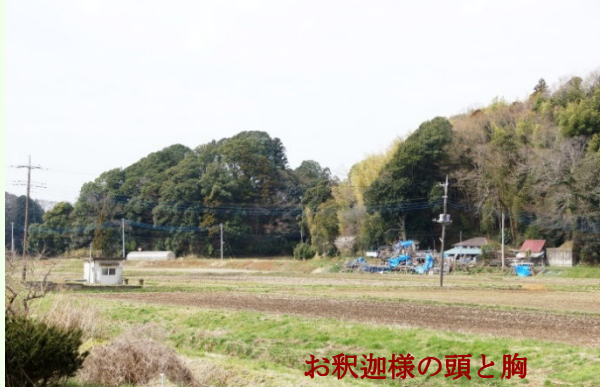
お釈迦様の頭と胸

普通”八街”と聞くと”落花生”のイメージですがここまでは標高 10m 少しの水田地帯ばかり、しかし馬頭観世音の裏の